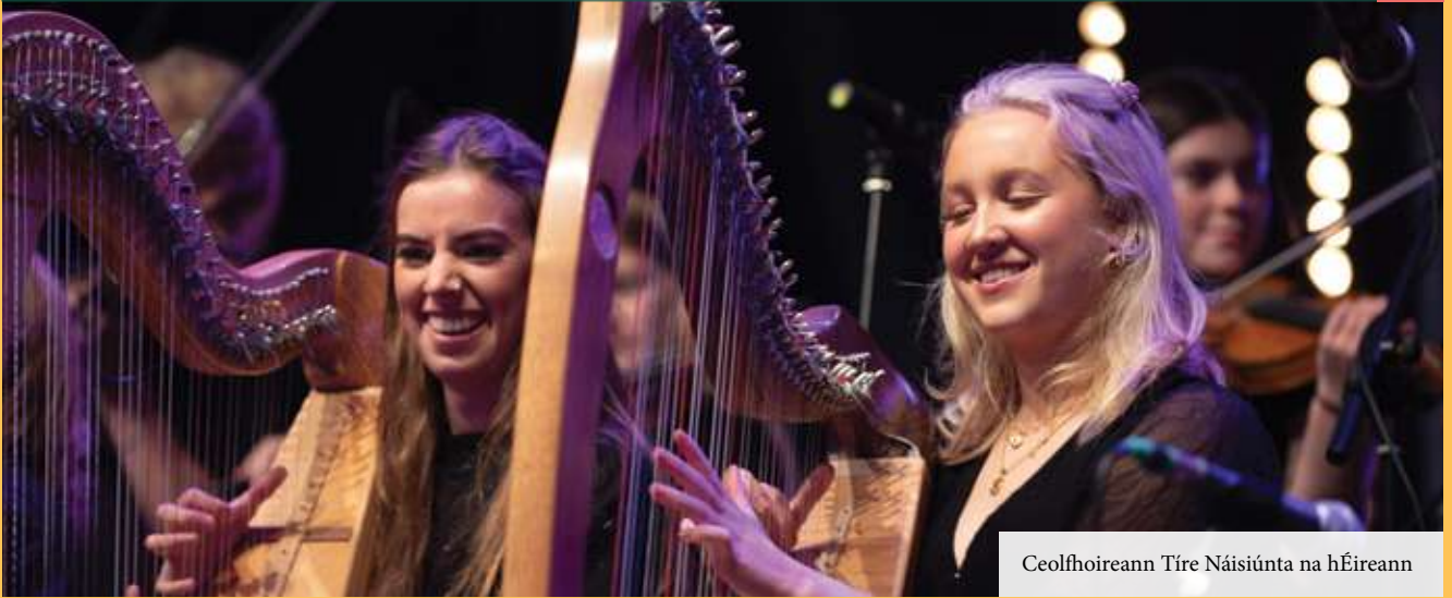
Ceolfoireann Tíre Náisiúnta na hÉireann