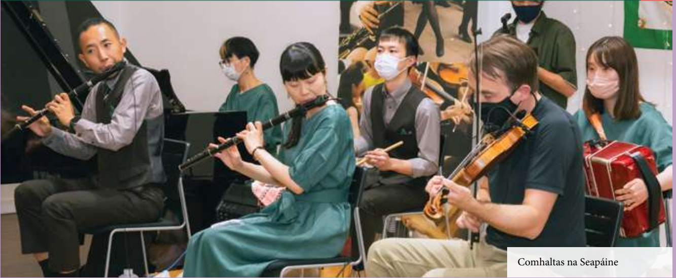
Comhaltas na Seapáine