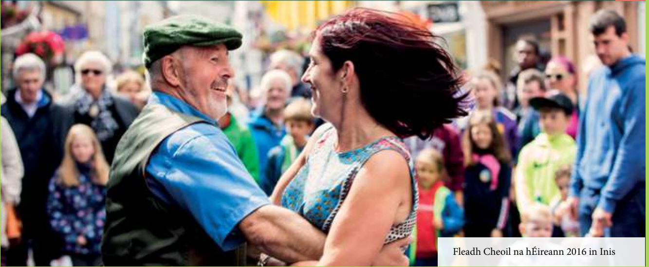
Fleadh Cheoil na hÉireann 2016 in Inis