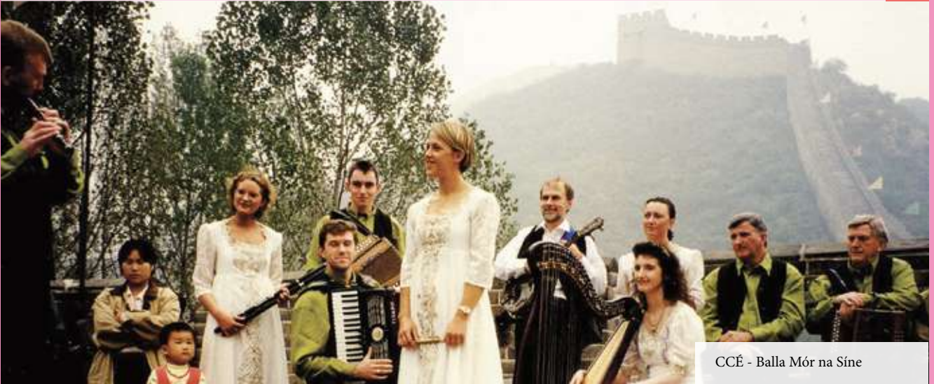
CCÉ - Balla Mór na Síne